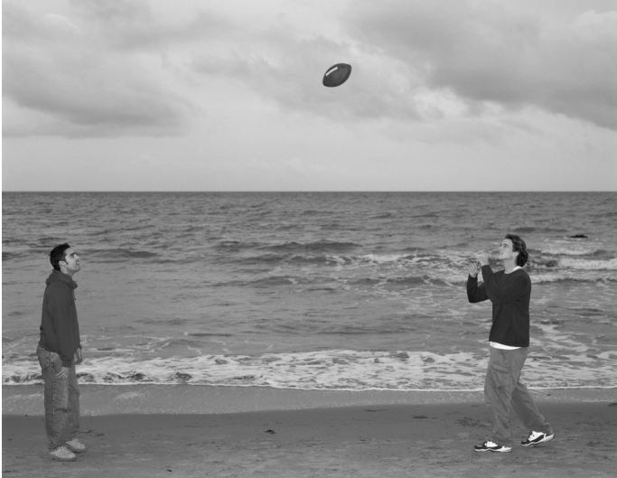
1. Lopta u letu I

već na modele . O modelu u ovom smislu može se razmišljati kao o zamišljenoj pojednostavljenoj verziji dela sveta koji se proučava, verziji u kojoj su tačni proračuni mogući. U slučaju kamena, odnos između sveta i modela otprilike je nalik odnosu između slike 1 i slike 2.