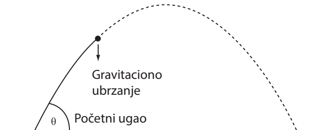
2. Lopta u letu II